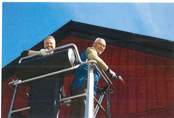
Arbete på hög höjd

omgivningar. Tveka inte att tipsa vänner om denna möjlighet.