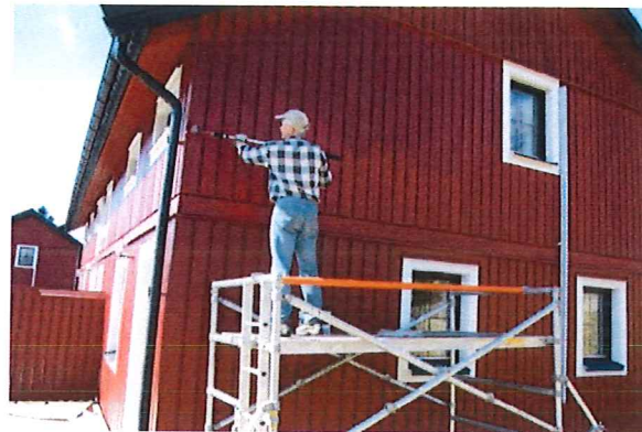
Fräsch fasad på hus 7