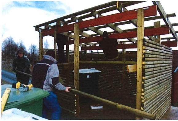
Soprummet krävde akrobatiska insatser