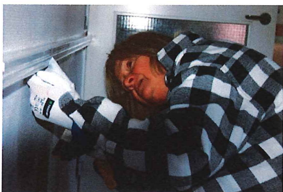
Och det är noga med detaljerna