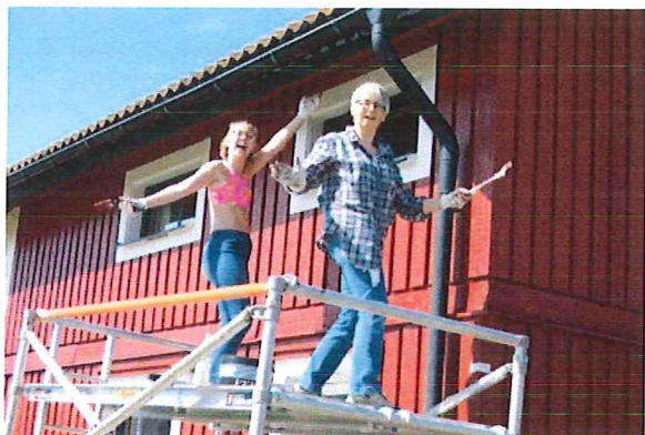
Fasadmålning med stil

upp ett kapital inför en kommande anslutning till det fibernät som kommer att byggas ut i Ottsjö. Många medlemmar har efterfrågat möjligheter att koppla upp sig mot nätet, och styrelsen tittar nu på möjligheter och kostnader.