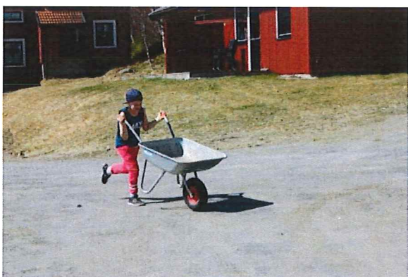
Full fart till nästa lass

Ni som inte hade möjlighet att komma i maj får en ny chans i höst. Nästa frivilliga arbetshelg blir den 30 september- 1 oktober, i anslutning till Åre Höstmarknad. Notera detta redan nu i almanackan, mer information kommer senare.