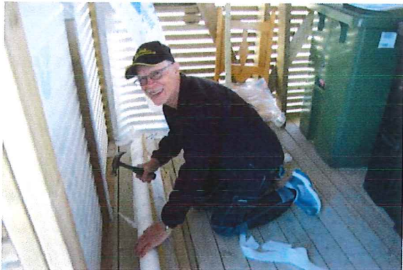
Soprummet blir tätare

Avslutningsvis ytterligare några bilder från arbetshelgen i maj: