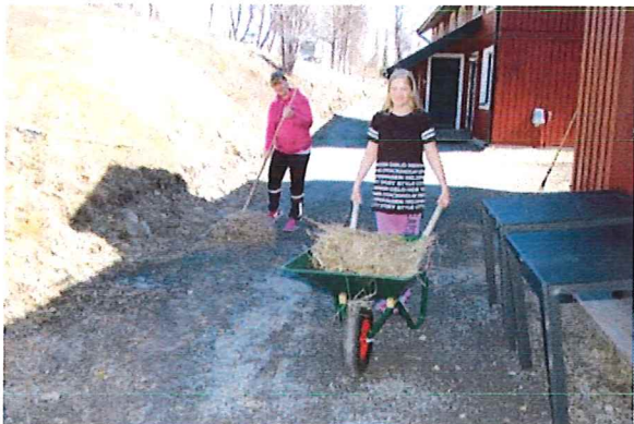
Fjolårsgräset rensas bort...