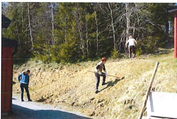
...och slänterna blir fina