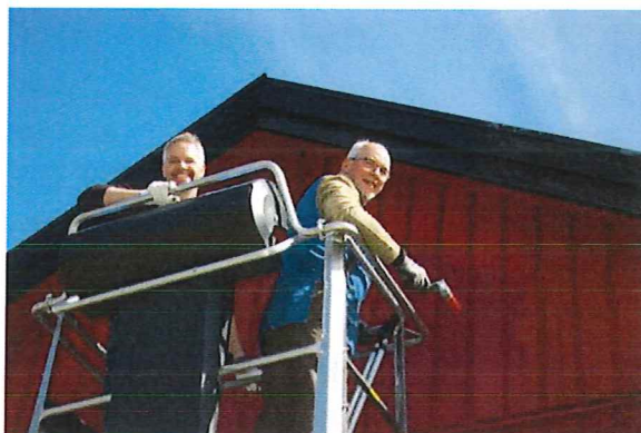
Arbete på hög höjd

omgivningar. Tveka inte att tipsa vänner om denna möjlighet.