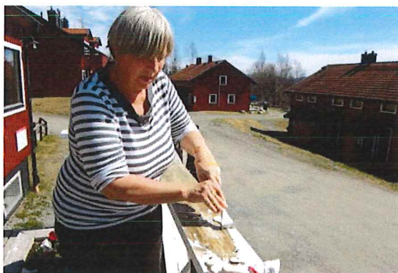
Wårdshusets altan snyggas till

Firar du kanske en högtidsdag i Ottsjö, eller kanske du vill uppmärksamma att det är allmän flaggdag? Flaggstången är på plats och i ett förvaringsutrymme i anslutning till pingisrummet i Wårdshusets källare finns flaggan. Välkommen att hissa den, och om den har blivit våt när du tar ned den, så torka den innan du lägger flaggan tillbaka.